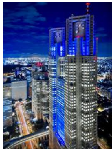
2023年シンボルライトアップ 東京都庁舎 （協力・東京都）

本年は、東京都にご協力をいただき、都庁舎をシンボルライトアップとして設定するほか、札幌時計台（北海道）、松本城（長野県）、大阪城（大阪府）、明石海峡大橋（兵庫県）、海峡ゆめタワー（山口県）など、全国の著名な建造物をブルーにライトアップし、世界糖尿病デーをアピールします。