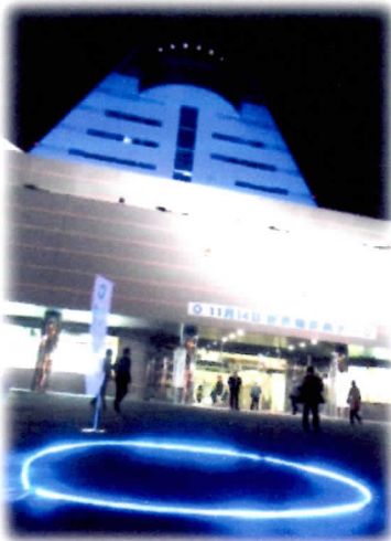
▲H28年のブルーライト アップ&ブルーサークル

【後援・協力】青森県糖尿病協会・青森県観光物産館アスパム (青森市安方1-1-40)