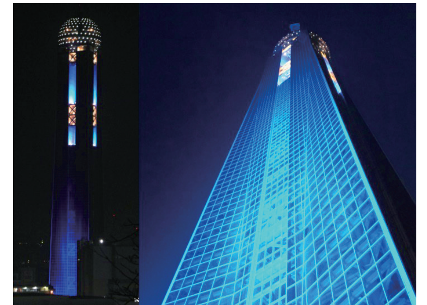
「海峡ゆめタワー」(山口県下関市)

詳細は公式HPをご覧ください 「世界糖尿病デー」ホームページ http://www.wddj.jp