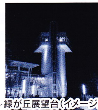
緑ヶ丘展望台(イメージ)