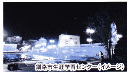
釧路市生涯学習センター(イメージ)