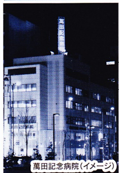
萬田記念病院(イメージ)