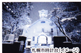
札幌市時計台(イメージ)