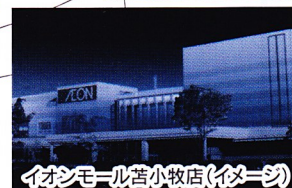
イオンモール苫小牧店(イメージ)